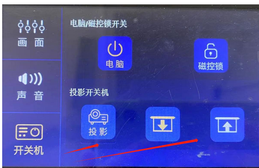
图 5 投影仪开关及幕布升降操作图

教师如果需要关闭或打开投影、幕布，可在中控屏幕内点击开关机菜单，选择投影和幕布操作键。