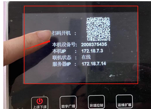
图 2 触屏显示开机二维码图

(2) 关机操作：①拔卡，中控将联动关闭全部设备（电脑、投影、幕布等）②长按上课下课键 2-3 秒，中控联动所有设备关机。如下图 3 所示：