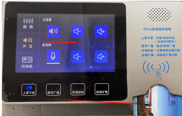
图 1 插卡开机图

(1)、多媒体一体机开机操作有二种方式：①插入饭卡；②手指触摸中控显示屏，微信扫描显示的二维码；开机完成后，中控将自动开启电脑、音响、投影仪及幕布等；如下图所示：